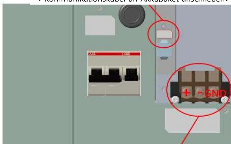
< Pluspol, Minuspol und Erde an Akkupaket anschließen >