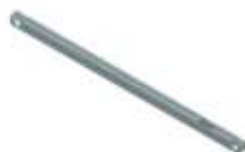
< Wandhalterung >